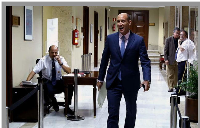
El diputado socialista por Cuenca Luis Carlos Sahuquillo

El portavoz de la Comisión del Estatuto del Diputado, Luis Carlos Sahuquillo, lamentó ayer que el resto de los grupos parlamentarios de dicha comisión hayan rechazado la propuesta socialista para reforzar el control sobre las actividades extraparlamentarias de los diputados. Entre otras cosas Sahuquillo planteaba examinar uno a uno a todos los diputados que hacían compaginar el escaño con otra ocupación. Finalmente, el resto de