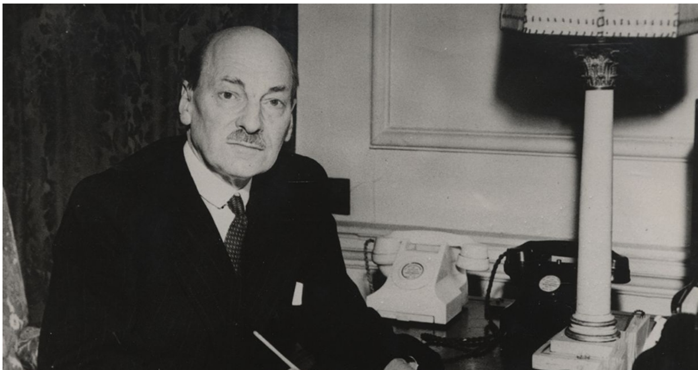
El laborista Clement Attlee