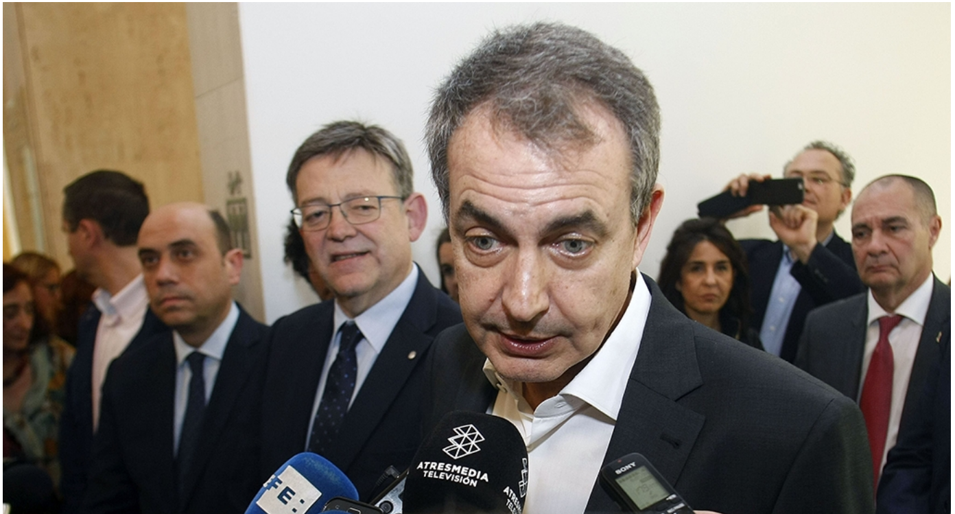
El expresidente del Gobierno, José Luis Rodríguez Zapatero, atiende a los medios