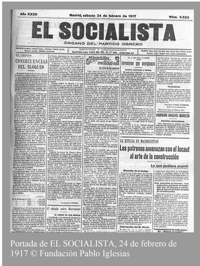
Portada de EL SOCIALISTA, 24 de febrero de 1917