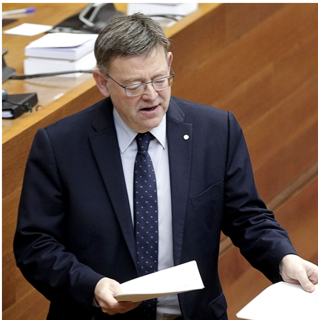
El president de la Generalitat, Ximo Puig