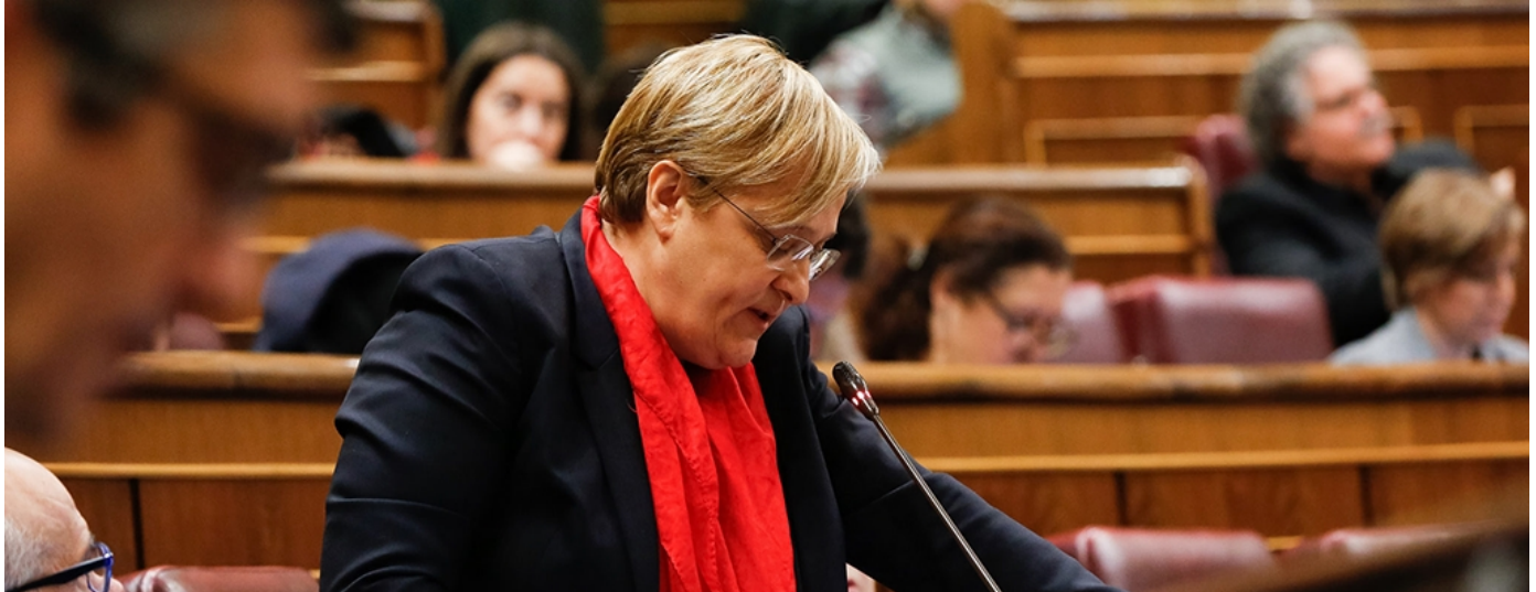
La portavoz de Igualdad, Ángeles Álvarez