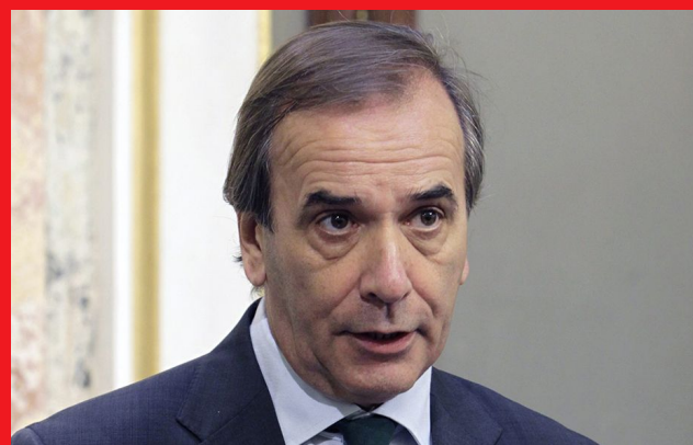
El juez y político socialista, José Antonio Alonso, fallecido este pasado día 2

León rendirá hoy un homenaje al juez y político José Antonio Alonso (León, 1960), fallecido en Madrid el pasado 2 de febrero, al que asistirán amigos y compañeros como el expresidente del Gobierno José Luis Rodríguez Zapatero. El homenaje ha sido organizado por la familia del político leonés y comenzará a las 19.30 horas en el Aula Magna de la Universidad de León y, además de Rodríguez Zapatero, se espera la presencia de